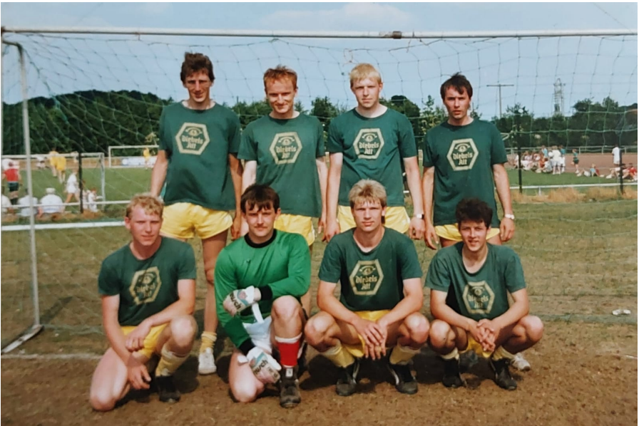
dat Trüppken van Rosengoarn 1989 - 13. Platz